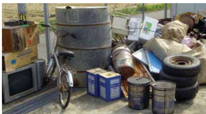
▲自転車・タイヤ…不法投棄の現状です。