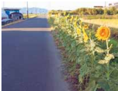
ひまわりの植栽(H19)(下高橋環境保全組合)