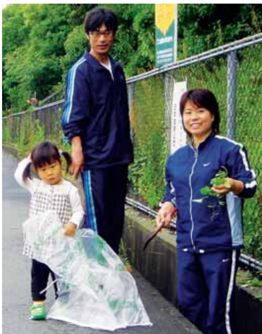
▲小さな子どもまで参加してくれました。