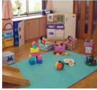
▲ちやお リスルーム

「歯が痛み出したので治療に行きたいけれど…」 「用事があったて出かけたいけれど…」 「仕事を探したいのでハローワークに行きたいけれど…」 こんな時、子育て支援センターでは半日や一日だけの保育をしています。家庭的な雰囲気の中で過ごします。