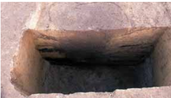
柱穴の半分を掘ってみるところ