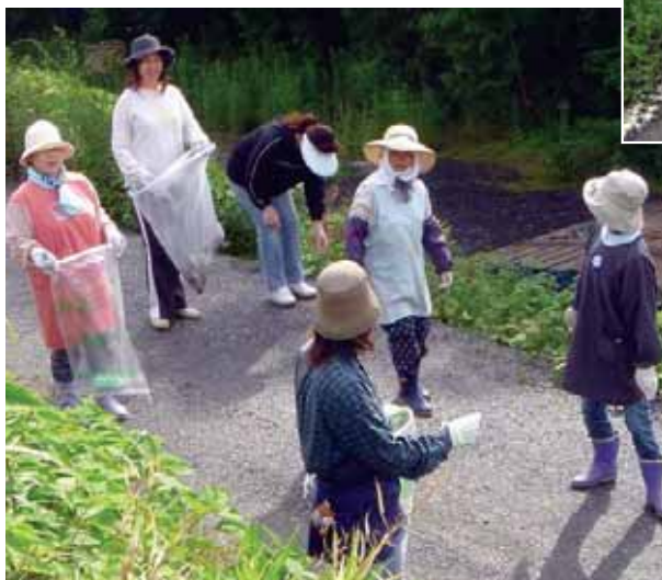
▲みなさんご協力ありがとうございました。