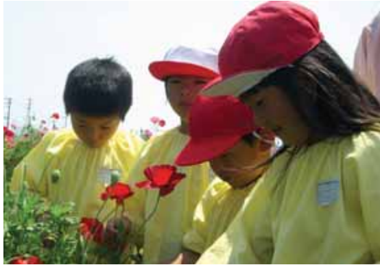
▲きれいな花だなあ～