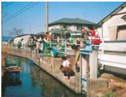
子どもたちによる生き物調査の様子。小エビが捕獲されました。(栄田環境保全組合)

農地・水・環境保全向上対策の活動を報告します。町内17の活動組織が農道や水路の環境整備、植栽等さまざまな取組を行っています。皆様のご理解とご協力をお願いします。