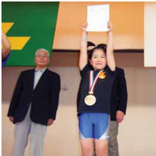
▲目指せ8年後のオリンピック選手