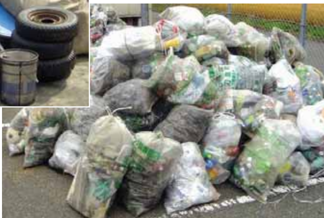
▲ペットボトルだけでも、これだけ捨てられました。