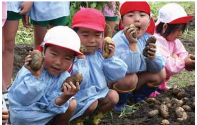
▲じゃがいもいっぱい獲れたよ

園児たちも先生たちも泥んこになりながら、土の中のじゃがいもを一生懸命掘って探しました。じゃがいもは、2カゴいっぱい収穫、園児たちは、自分の手よりも大きなじゃがいもを両手に持ち、満足の笑顔を見せてくれました。