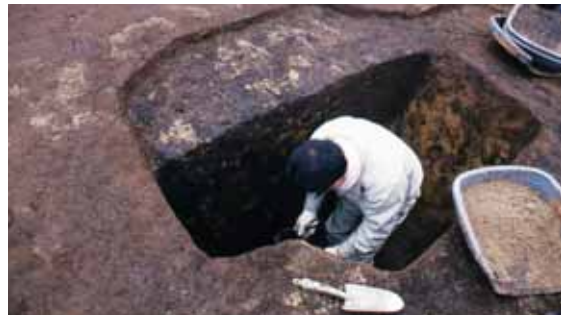
柱穴の調査の様子。柱穴を半分掘っています。人がすっぽり入る大きさ・深さ。