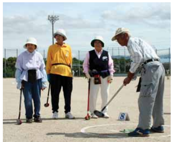
▲ナイスショットです

また、6月4日(水)に大刀洗運動公園で交通安全グラウンドゴルフ交流大会が開催されました。多くの方が参加され、選手同士声をかけあいながら楽しく運動をされていました。