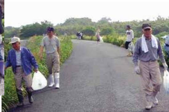
▲隅々のごみも集まりました。