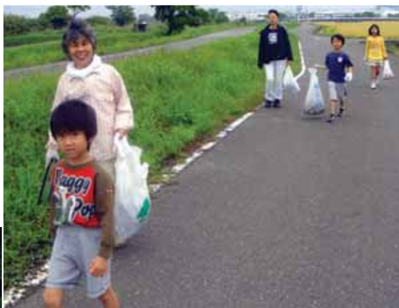
▲ごみ袋の中は集めたごみでいっぱいです。