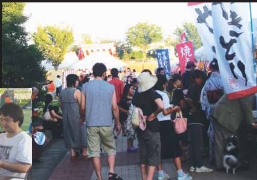
↑いい匂い〜焼きとりおいしそう