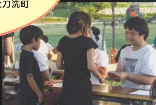
↑なに食べようかな♪