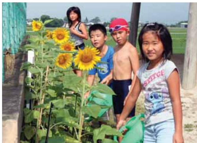
↑咲いたひまわりに水やりをする大刀洗小学校の4年生