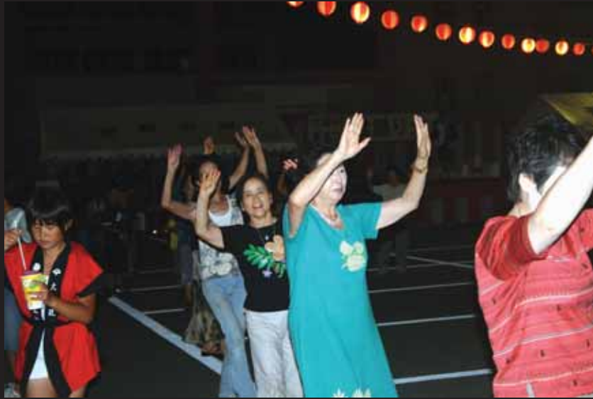
↑ほんによいとこ大刀洗〜♪