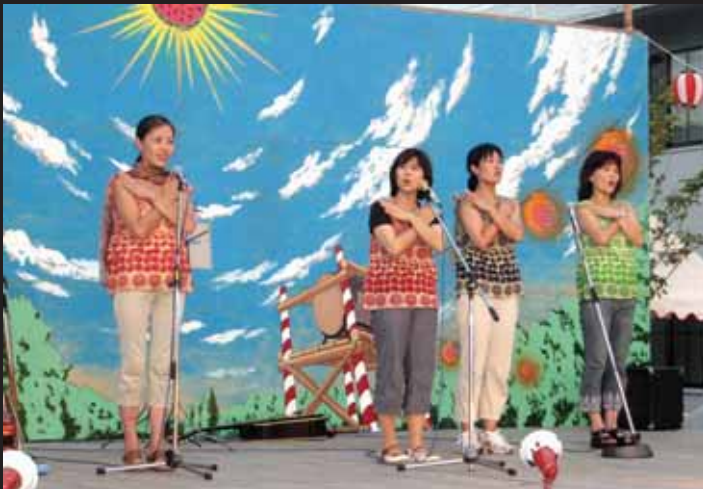
↑会場でミニコンサートを開きました。入所者の皆さんも一緒に歌や手拍子で参加し、楽しいひとときを過ごしました。