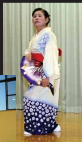
↑美しい舞が披露されました