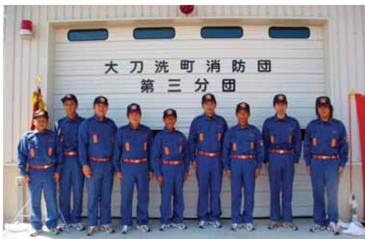
↑新しい格納庫と大刀洗町消防団第3分団