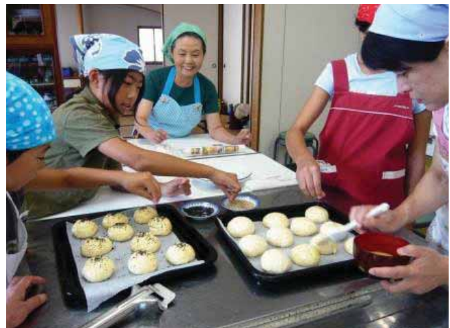
↑みんなでパンの生地をこねたり、卵をパン生地の上に塗ったりしました。