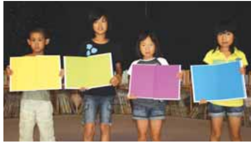
↑「自分の本が出来たよ」