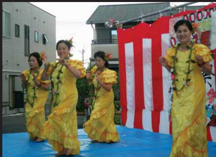
↓「好きにならずにいられない」「港町13番地」など4曲を披露し、夏まつりを盛り上げました。