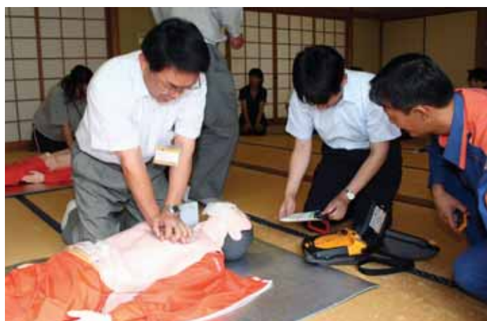
↑命を救うには心肺蘇生法(左)とAEDの使用(右)の連携がとても大事です

今回の講習ではその応急手当として心肺蘇生法とAED(自動体外除細動器)の使い方を救急救命士と消防士の方に教えていただきました。