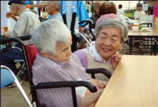
←利用者を誘導したり、買い物などを介助したり、ボランティアで祭りを応援しました。