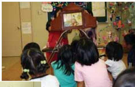
↑おり姫とひこ星の紙芝居をみる子ども達