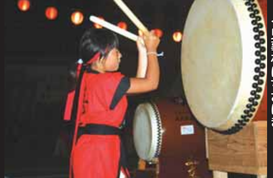
←息事なほちなほき