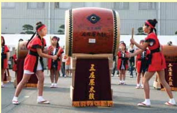
▲去年のドリームまつりでの演奏