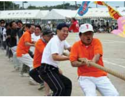
▲第39回大刀洗町民体育大会

本年度の町民体育大会は10月12日(日)に大刀洗町運動公園にて開催いたします。 各分館や小中学校を通じて各競技の出場選手を募集しますので、ふるってご参加ください。