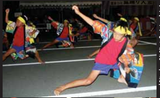
←カッパへくまきこてます