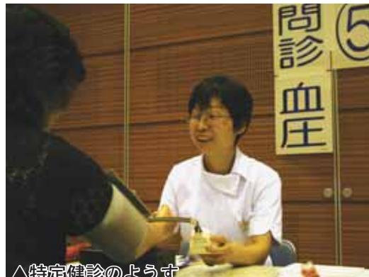
△特定健診のようす

特定健診を受けていただき、ありがとうございます！ 大刀洗町国保の特定健診は、病院と集団の2通りで実施しました。みなさん、受けていただいたでしょうか。 さて、肝心なのは健診を受けた後です。病院で受診された場合は、受診された病院で、健診結果について一人ずつ説明を受けます。集団健診の場合は、情報提供で異常がない人や、すでに治療中の人は郵送で結果をお渡ししますが、動機づけ・積極的支援と判定された方や、情報提供でも要受診の方については、健康管理センターに結果を取りに来ていただきます。