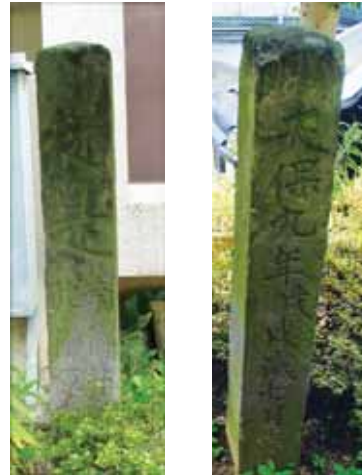
中央公民館前に移築された郡境石（正面・対面）

現在の大刀洗町が、昔の御井郡と御原郡に属していたことを、目で確かめることができます。