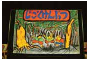
お話し「じごくけんぶつ」

でんでん虫文庫と図書館職員によるブックシアター。80名程の子どもたちが見に来てくれました。