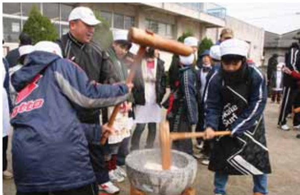
↑おいしい餅になるためだ