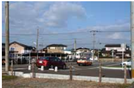
利便性がよくなった西大刀洗駅