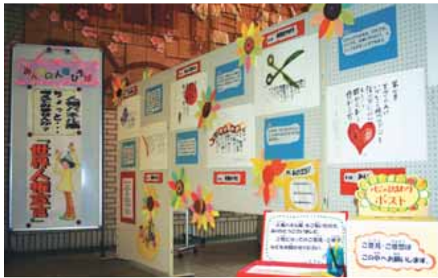
たくさんの人の思いが集まりました