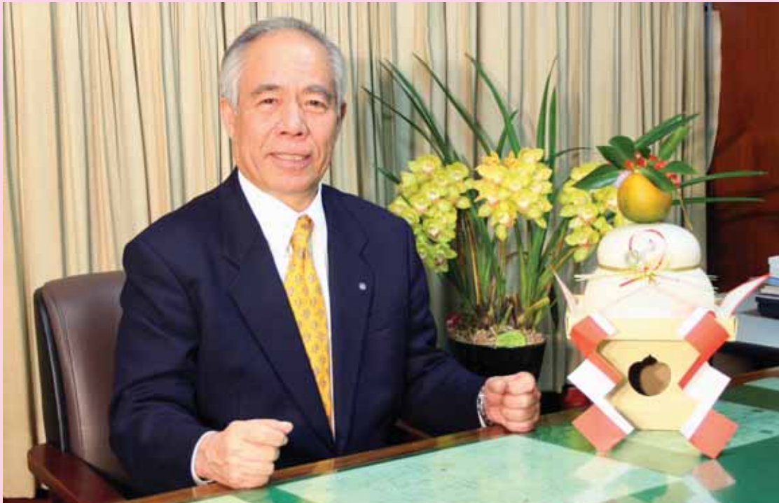
大刀洗町長 安丸 国勝