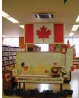
「赤毛のアン」出版100周年記念展