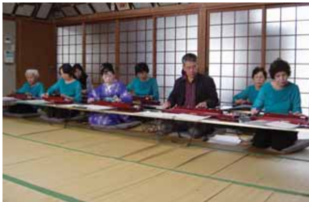
↑息の合った美しいメロディー