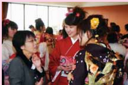
先生お久しぶりです