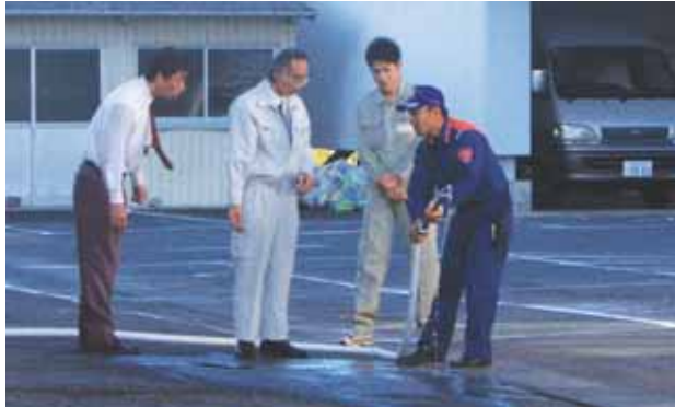
↑筒先はこんなふうに使うとですよ