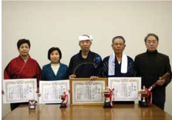
↑入賞おめでとうございます