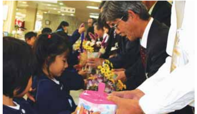
↑お仕事ご苦労さまです