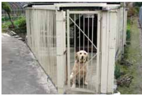
頑丈なおりで飼いましょう

散歩中にくさりを外すことも禁止です。いたずらに他人に恐怖を与えることのないよう飼い主の自覚が求められます。