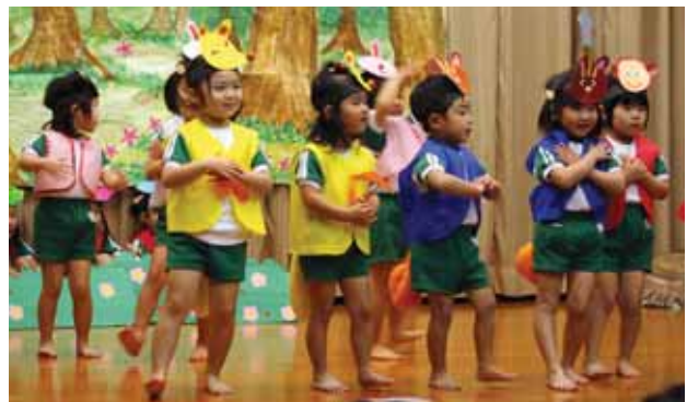
↑リズムに乗ってダンシング～

日頃の成果を披露した子ども達の姿に観覧者からは「かわいい」「おもしろい」という言葉や、大きな拍手が送られました。