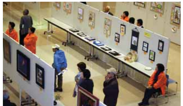
↑素晴らしい作品がここに集結