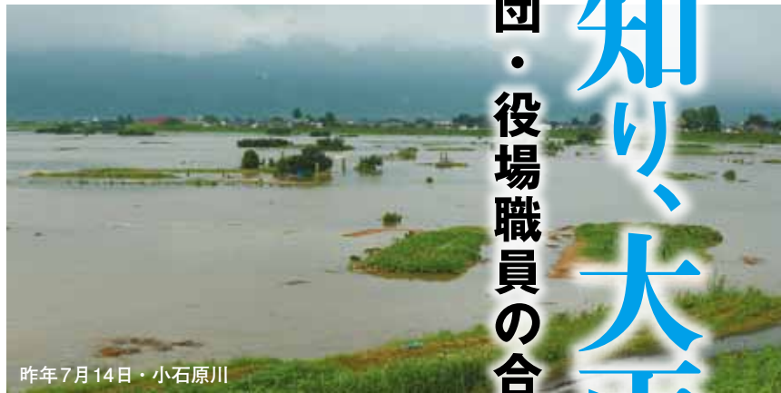
昨年7月14日・小石原川

昨年7月の九州北部豪雨からもうすぐ1年。町にも多くの被害をもたらした大雨の恐ろしさは、記憶に新しいところです。同時に、消防団を始めとする地域の力が被害の拡大を防いだことも忘れてはなりません。 4月21日回、筑後川河川敷の町民グラウンドで行った水防訓練では、三井消防署員の指導のもと、消防団員と役場職員が、土のう積み工法、シート張り工法等の技術を学びました。 梅雨入りを控えた6月。皆様も、地域の一員として「もしも」に備えましょう。