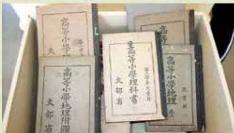
戦前の小学校教科書