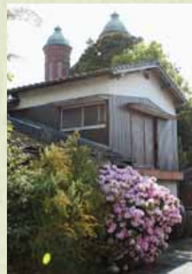
旧今村切支丹史料館

公開するなど、「今村の名物おじさん」でしたが、平成17年に惜しくも他界されました。