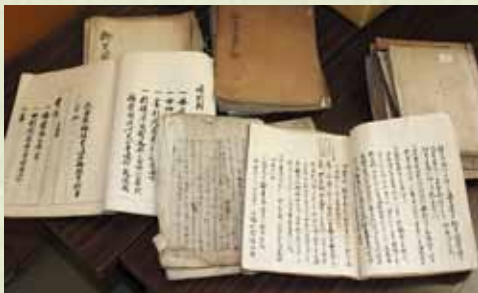
キリシタン・郷土史関係古文書

資料整理はまだ始まったばかりですが、来月からは一部の資料をこのコーナーで紹介していきたいと思えます。