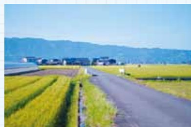
毎日の通勤風景も美しい

温かく受け入れて下さる方々に感謝し、当稿では次号からヨソモンの見たヨカモンば、より深く書いていきます。 (文:本多慶考)