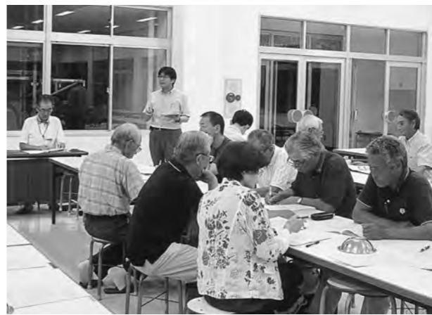
校区民会議はさまざまな団体が構成されている

役員内で、地域や自治組織などに係る連絡会議を設置した。今後も定期的に開催を予定している。校区を核とした地域づくりも、これまでの取り組みを振り返り、次のプランを検討したい。