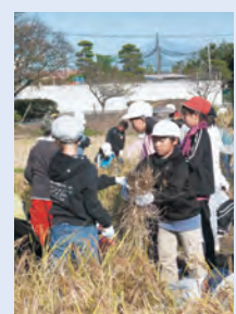
【表紙の写真】 菊池小のみ なさん。田植えから観察、刈 り入れまでがんばりました。