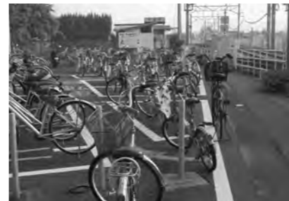
住民が使いやすい駅に

議員 本郷駅前には送迎場所もなく不便であり、通勤通学者及び住民も迷惑している。町総合計画でも示されている利便性向上の検討は進んでいるのか。せめて駐輪場の屋根取り付けなどは。 町長 駅周辺は住宅地であるため、移転に必要な予算の確保や地権