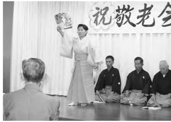
地域活動の推進を