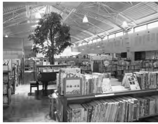
建設時から住民の声をとり入れた伊万里市図書館