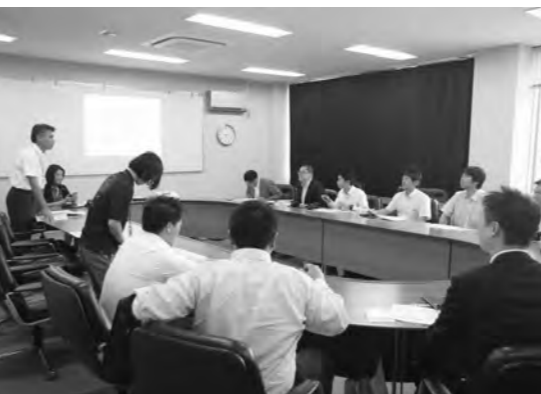
全国から視察者が訪れている

町長 ②全国で15自治体が加入している。年末には30〜40になるとのことだ。本町では9品目(季節限定2品目)指定だが、今年度中に15〜20品目にした。今までの総売上げは126万円。③アジア市場に注目が集まっており、大刀洗町が海外と商談できる機会を得たことは意義が大きい。国内で町特産品のイメージアップ及び地域力の向上、町内産業の活性化を図ることを目的にFB良品事業や情報を発信してきた。町のブランド力が向上