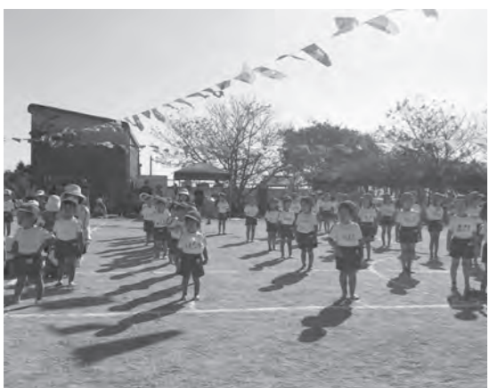
子育て新システムの影響は

県が徴収することができない両筑土地改良区の負担金を、この条例で町が徴収し、県に支払うための条例改正。