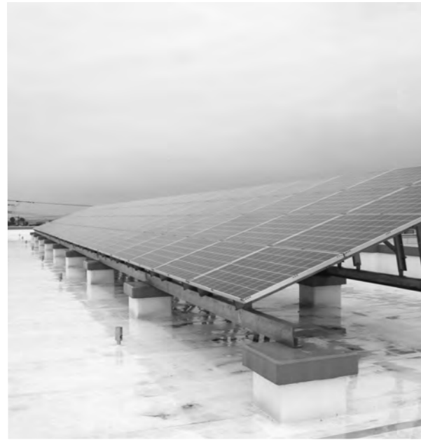
中学校屋上の太陽光発電

町長 24年度までの3年間で182件。補助金は1kW当たり3万円、上限が9万円交付しているが、年々発電設置費用が安価になり国の補助金が見直しが行われ、当町も今年度から1kW当たり2万円、上限6万円に下げている。