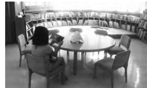
みんなの図書館をめざして

教育長 専用出入口の設置、階下書庫の増設、各種コーナーの配置、学習スペース確保、カフェコーナー等の設置などを図書館協議会で検討してきた。町民ニーズをアンケート等で調査研究し、少ない投資で限られたスペースを有効利用できるように改修を検討していく。