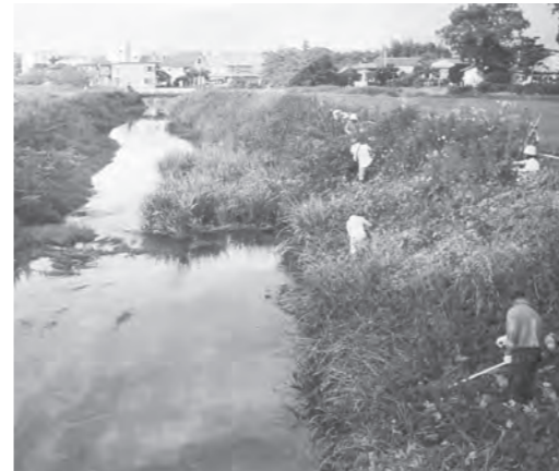
陣屋川の美化活動

課長 自治活動の清掃活動などで事故があると保障される。任意団体だと対象外になる場合もある。