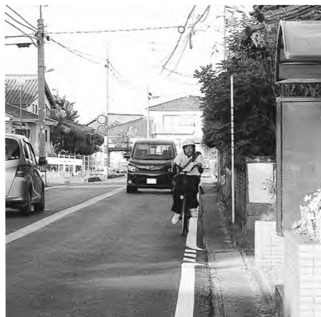
自歩道未整備の部分

の蓋の上を自転車で通っている状況である。重大事故が起きる前に、早急な対応を強く要望する。