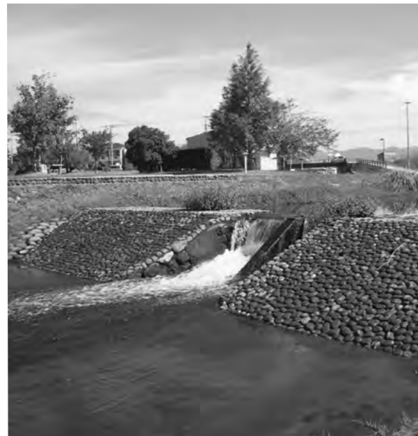
豊かな水流を活用できないか

議員 大刀洗公園内の大刀洗川に小水力発電設備を設置できないか。 課長 維持管理とその他費用対効果を考えた場合、なかなか難しい。今後の技術向上で実用的になれば検討したいと考える。