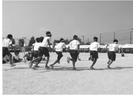
誰もが生き生きと学べる学校を

議員 いじめについて、原因をどう分析するか。対策は。 教育長 いじめには加害側、被害側だけでなく、傍観者、観客の存在もあり、だれもが加害者や被害者にもなりうる。