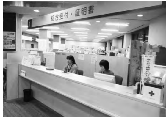
時間延長の周知を

議員 窓口の延長時間中に、これまでどれくらいの取扱件数があったか。また、住民周知は十分だったのか。