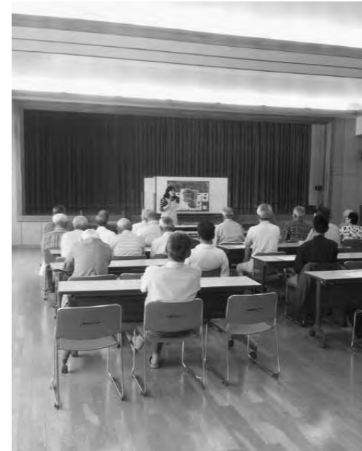
社会変化と福祉施策にズレはないか

議員 20年前と比較すると、高齢者は10歳若返っているという科学的データがある。このまま65歳以上を高齢者として事業を行うのは、やめるべきではないか。 町長 年齢の区切りは全国的に施策の基