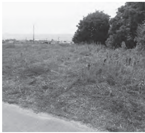
放棄地の有効活用を