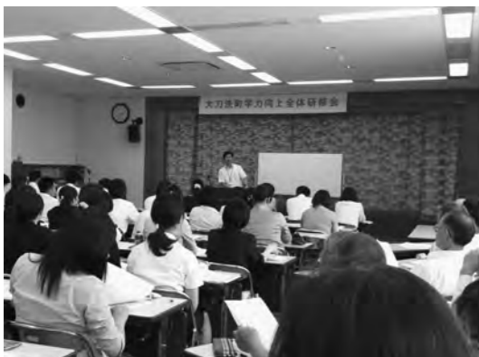
分かりやすい授業をめざす研修

教育長 確かに現場の事務負担は大きいので3つの対策をおこなう。①学校支援員を配置し、担任などの事務を手伝える体制。②学習生活ボランティアを組織し活用。③町が行っていた教員への研修会を削減し、時間を確保。