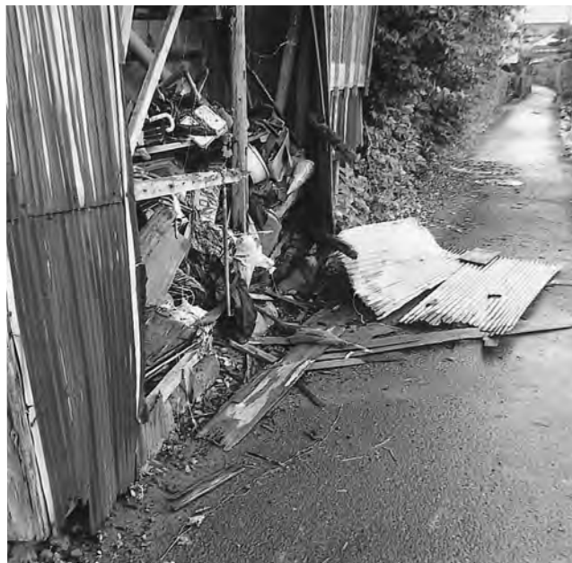
近隣住民からも不安の声が