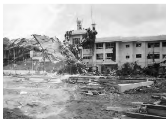
大きな被害を受けた南三陸町の病院