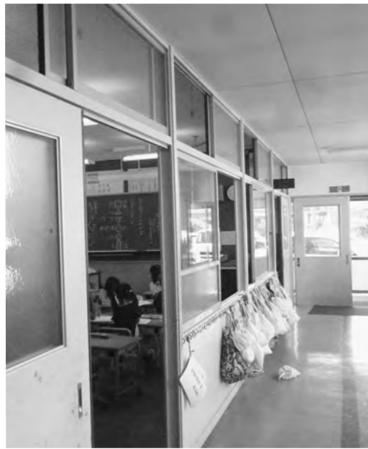
猛暑にどう対応するか

と、このところ検討はしていないが、住基カードの条例が一部改正されるので、必要になってくれば検討を進めたい。