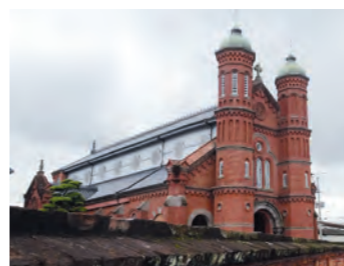
来場者が増えた今村天主堂

議員 周辺道路がかなり狭い。来訪者と住民との交通事故のトラブル防止のためにも通行規制も含めた検討が必要では。