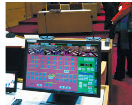
映像中継システムを調査(刈田町)