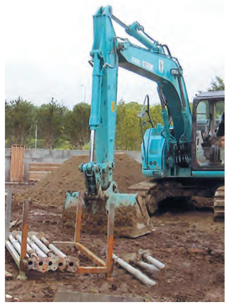
現在も住宅開発がすすむ菊池校区

議員 ウェスタンリーグ公式戦のチラシ配布・ポスター貼りや教育委員会を通じ区長に依頼があった。営利事業の宣伝は区長