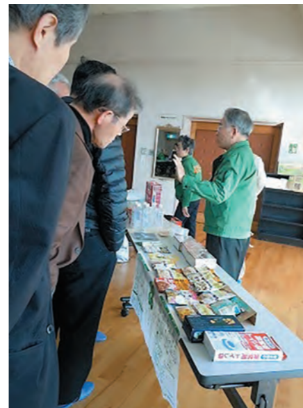
高齢者が主体となった防災活動も(西国分校区)

町長 住民の健康増進を促進することは介護予防につながり、福祉のコスト抑制にもつながる。地域包括ケアシステム構築と関連するため、平成29年4月をめぐりに住民主体のサービス提供について準備を進めている。地域で活躍できる人材やボランティア団体などが