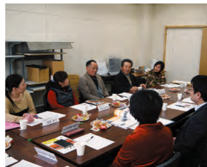
議会モニターとの意見交換

議会基本条例を制定して1年が過ぎました。全議員で到達状況を議論し、成果と課題を確認しました。引き続き改革に生かします。