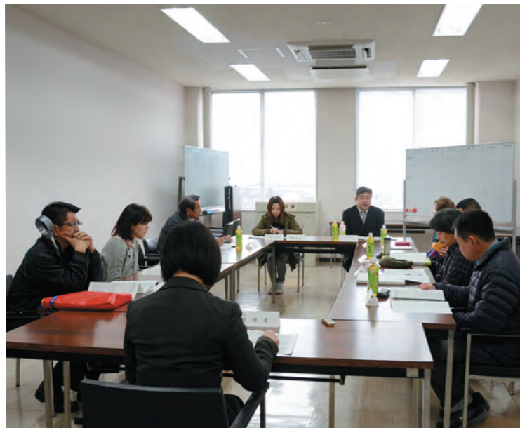
住民協議会の分科会

議員 構想日本の指導を受けて住民協議会が開催されている。構想日本への委託金約400万円と45人の委員の費用弁償72万円など、約500万円の予算が組まれている。26年度は、試行も含めて「ごみ問題」3回、「地域包括ケア」3回、「地域自治団体と行政の役割」3回が協議され、提言書が出されたが、