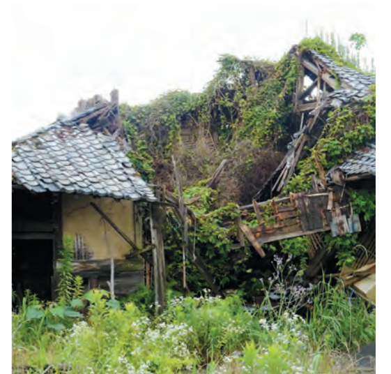
安全の点でも緊急の課題

が3件、害虫駆除に関しては1件改善した。 ③9件の空き家等について文書送付や電話でお願したのが7件、残る2件は、相続人未確定と所有者住所不明。 ④現在、県、市町村、関係団体で構成される空き家対策連絡協議会で統一的な基準を作成している。周囲に及ぼす危険性など、所有者、管理者の方々にしっかり説明し、粘り強く改善を促したい。