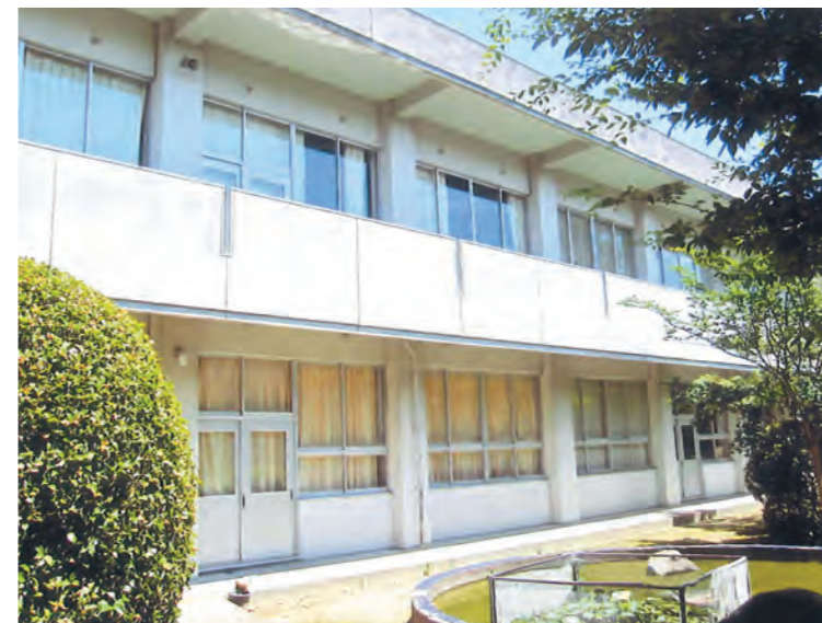
今後の学校改修はどうなる(菊池小)