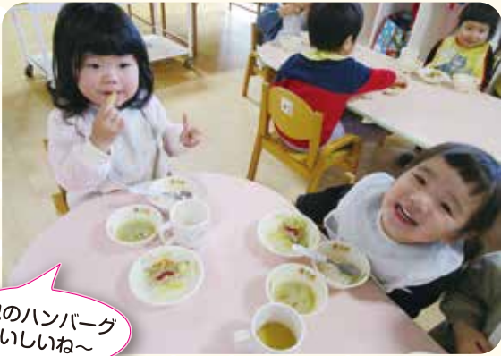
鬼のハンバーグ おいしいね～