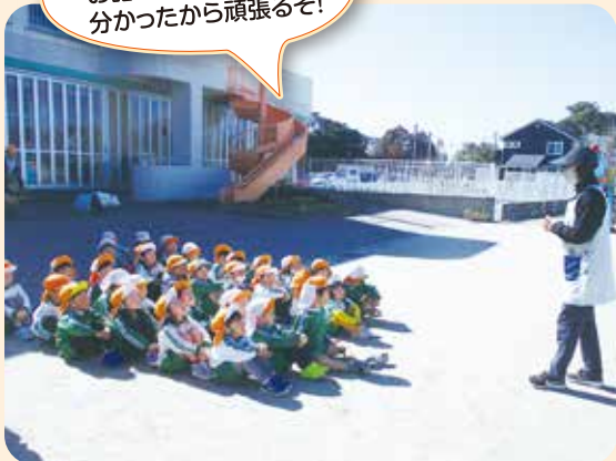
しっぽ取りゲーム。 お話を聞いて、やり方が 分かったから頑張るぞ！