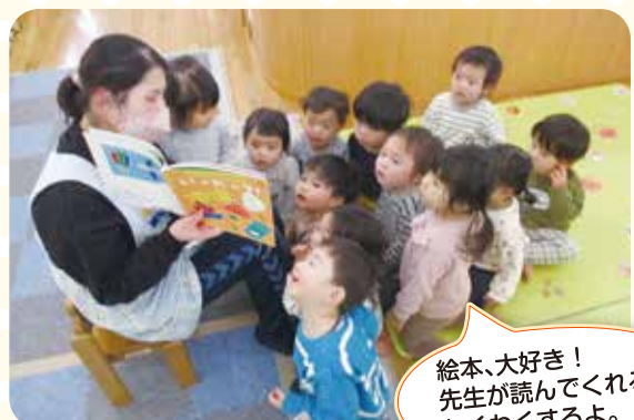
絵本、大好き！ 先生が読んでくれると わくわくするよ。