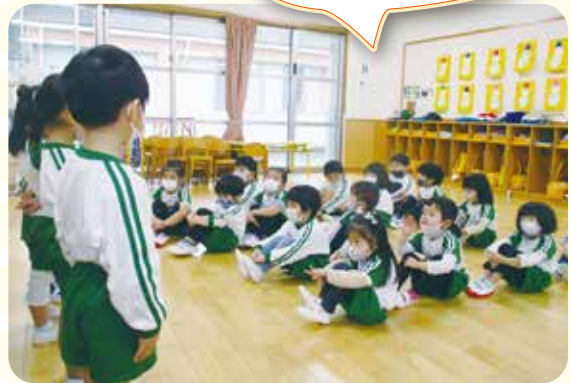
朝の会。今日は何があるかな？ 今日も一日元気に過ごそう！

挨拶をする時、活動をする時、お話を聞く時の合言葉『足ペタ 背中ピン 目と目』で、子どもたちはパッとお話を聞くモード。先生やお友だちのお話をよく聞いて、子どもたちはいろいろなことにチャレンジしたり、遊んだりしながら毎日楽しく過ごしています。