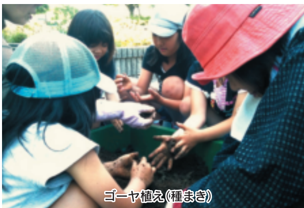
ゴーヤ植え(種まき)

でよく混ぜて、土作りをしてから植え込みました。子ども達は、喜々として土作りに精を出しました。ボランティアの方が、のり網を使って柵を作ってくださいました。一ヶ月程度過ぎた今、苗はグングン伸びています。夏休みには、ゴーヤ