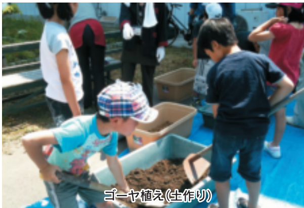
ゴーヤ植え(土作り)

うに見入っていました。※グリーンカーテンづくりふれあいセンターに、グリーンカーテンを作ることになりました。五月二十六日にゴーヤの種をポットにまき、発芽した苗を六月五日にプランターに植えました。大きなプランターに底石を敷き、土とめぐみちゃん(牛ふん)をスコップや移植こ