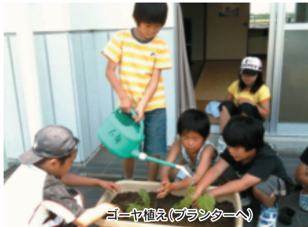
ゴーヤ植え(プランターへ)

学校から広場に来た子ども達は、感心なことに宿題をします。その後は自由遊びで、それぞれに楽しんでます。本郷アンビシャス広場で、夢と志を持ったア