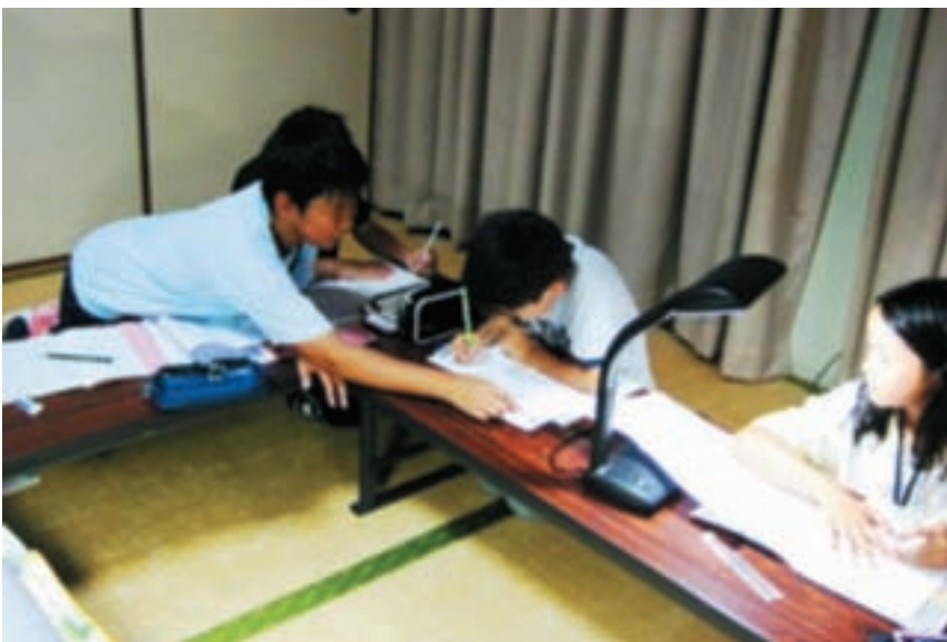
▲夜の宿題も協力して！集中して！

家ではおうちの人がお母さん、お父さん、おじいちゃん、妹、お姉ちゃんがさみしいと思いました。学校にいつて勉強をしたら、お手紙がとどいていっぱいかいていました。私はとてもうれしかったです。