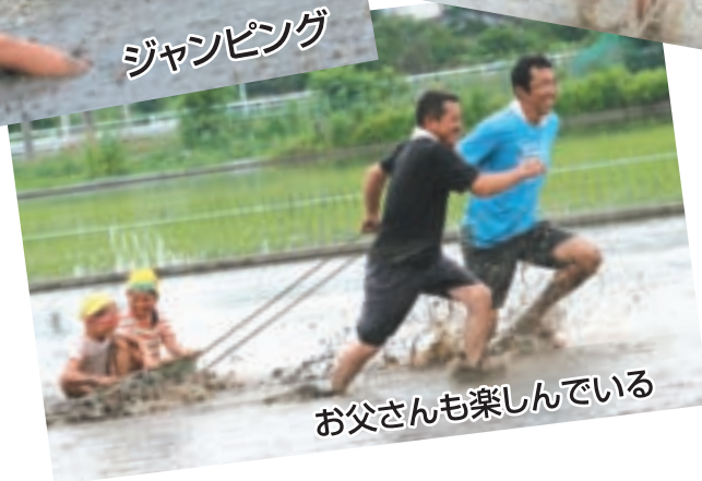
お父さんも楽しんでる