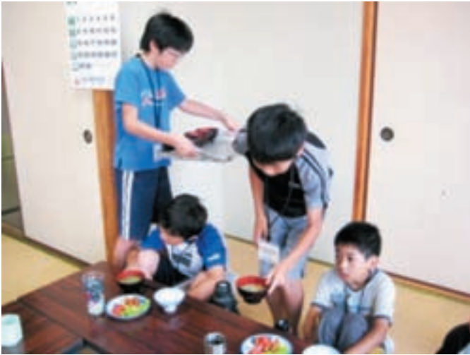
▲配膳もみんなでやります。