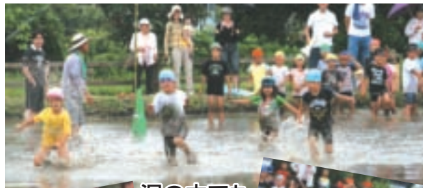
泥の中でもかまわない

たつて準備・運営とご尽力いただいた方々、お疲れ様でした。私自身、このような体験をできた事に感謝します。また、私達の為に、お昼のおにぎりを作つてくれたアンビシャス広場の子ども達やお母さん方お世話をおかけしました。これからも、他の校区の方々から地域と子ども達とのつながりがありが、あつてすこいね。羨ましいいね」と言われ続けたものです。