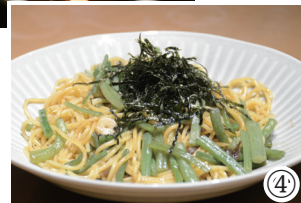
①店内の様子 ②調理している様子 ③特製デミカツ ④おっかさん直伝「山菜パスタ」

になってもらい、ファンになってもらえるよう、特に下処理や仕込みなどは手を抜かず、しっかりと時間と手間をかけることを大切にしています。寿司屋で修行した経験から、みそ汁や煮物などの和食料理は毎朝ダシを一から取り、醤油などの調味料は、それぞれの料理に合うよう独自にブレンド。また料理で使用している野菜の多くは、町の農家さんから採れたてで新鮮な野菜を直接仕入れられています。