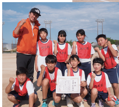
▲準優勝：西本郷分館B