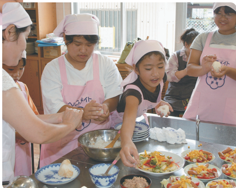
デコボコおにぎりもご愛嬌