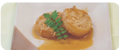
ふろふき大根 (みそあん)

大根は、部位によって味が異なり、葉の近くが甘く、先端は辛くなります。ビタミンCが豊富で、消化を助けるでん粉分解酵素ジアスターゼを含み、葉はカロチンが豊富に含まれています。