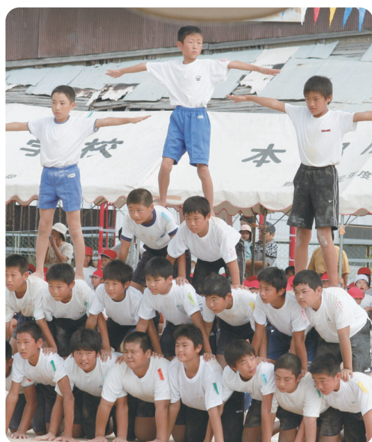
力を一つに20人タワーの完成