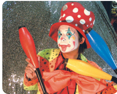
イリュージョン「ちゅー太」