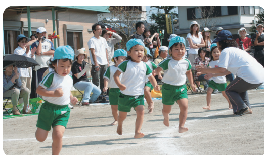
ヨーイドン！走れ～がんばれ