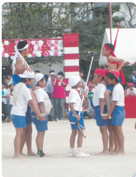
大将同士のにらみ合い

9月23日(日)に本郷小学校、菊池小学校、10月6日(土)に本郷保育所の運動会が開催されました。白熱した騎馬戦では攻防陣ともに力をぶつけ合い。応援合戦では自陣營の勝利を願う士気を奮い立たせました。また、練習成果を発揮した規律の取れた組体操や見事に演奏を奏でた鼓笛隊など数多くの催し物がありました。観客の保護者たちも子どもの勇姿に歓声を上げていました。