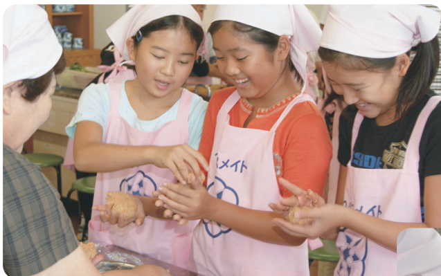
手作り的大豆ハンバーグ栄養満点