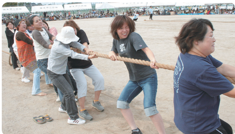
さあ今こそ女性の底力を見せるとき 「引け引けドンドン」