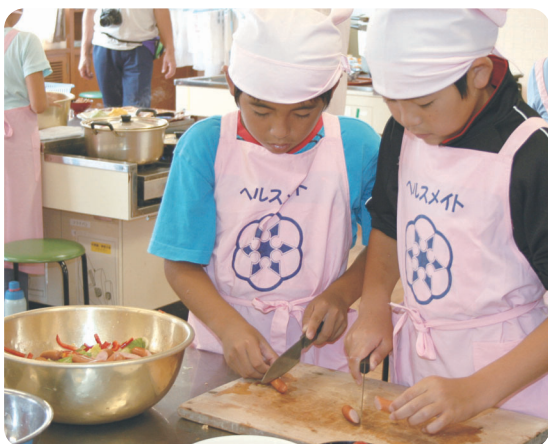
なかなかの包丁さばき