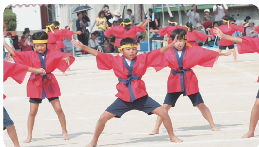
勝利を呼び込め！応援合戦