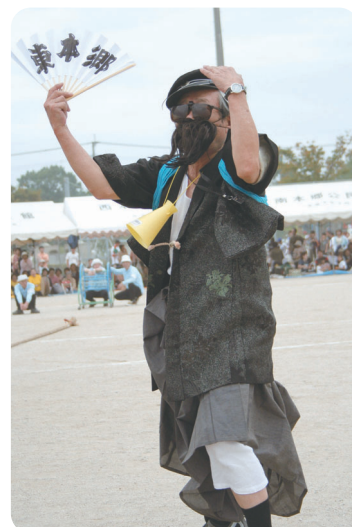
今年のめだったで賞！ 「本郷校区応援団」