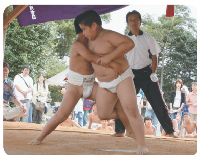
力のこもった大一番

9月29日(土)山隈老松神社において、老松神社奉納相撲大会が開催されました。山隈校区の小学生3年から6年生力士たちの壮絶な戦いが繰り広げられました。