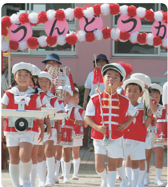
おそろいの制服がきまっています