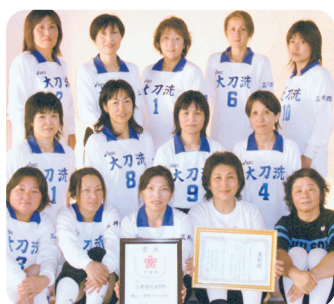
大刀洗の魔女、準優勝

剣道 青年男子の部 一回戦惜敗 一般男子の部 一回戦惜敗 ソフトボール 一回戦惜敗