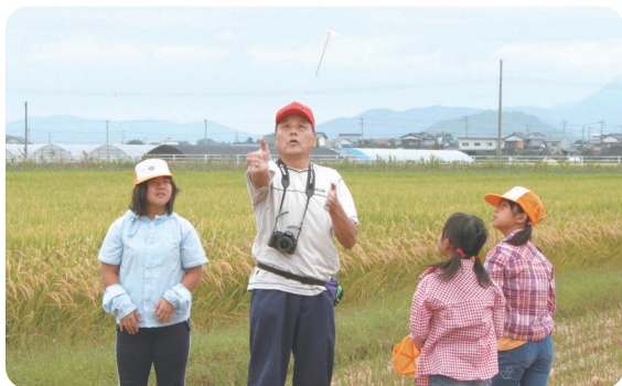
竹とんぼは上手く飛ばせるかな