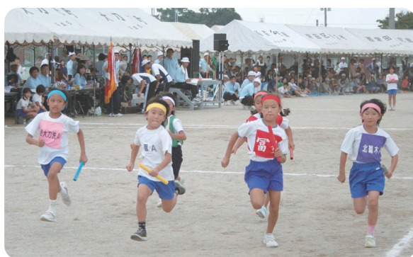
この競技が一番盛り上がりますね 「小学生学団リレー」