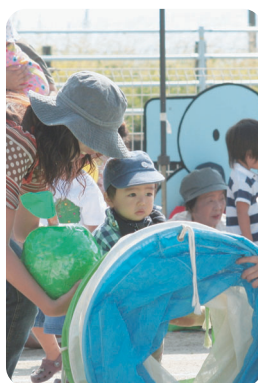
がんばってくぐったよ

10月6日(土)本郷保育所運動会に、子育て支援センターちやおも親子競技で参加しました。大勢の人の応援の中、泣く子もなく初めてするトンネルにドキドキしながら、風船とお菓子をもらいました。