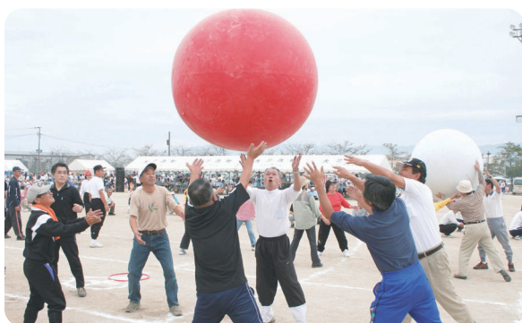
ほなこつ言うときかんばい 「玉が言うこつきかんばい」