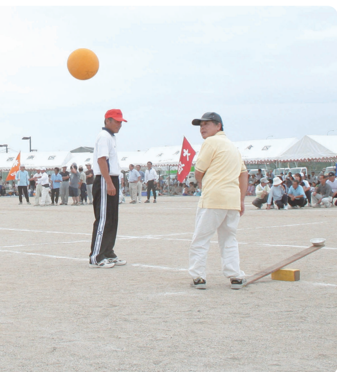
踏むほうが楽かも・・・ 「ナイスキャッチ」