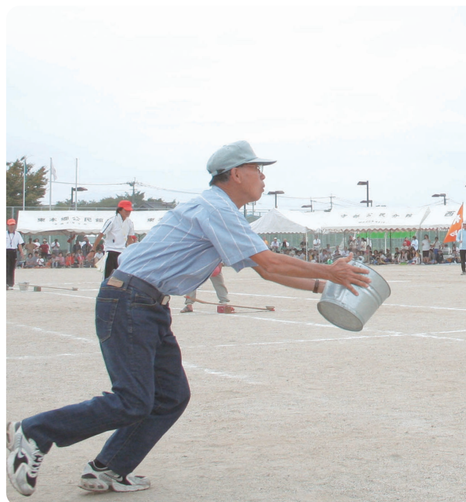
ボールが前やら後ろにやら 「シーソー」