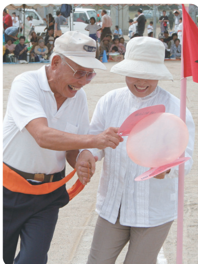
まだまだお若いですね 「ハートをひとつに」