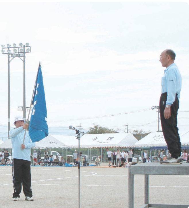
による力強い選手宣誓

10月7日(日)大刀洗町運動公園において、第39回大刀洗町民体育大会が開催されました。みんなの願いが届いたのか、ばらつく雨雲を吹き飛ばし、全26種目の競技に老若男女、多くの町民にご参加いただき盛会のうちに無事終えることができました。校区別対抗では大堰校区、本郷校区、菊池校区が最後の種目、鈴割りまで接戦を繰り広げましたが、勝利の女神は優勝への執念を見せた菊池校区に微笑みました。