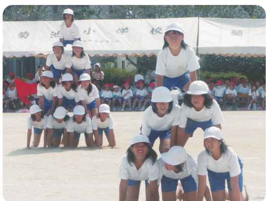
日頃の練習成果でバッチリ