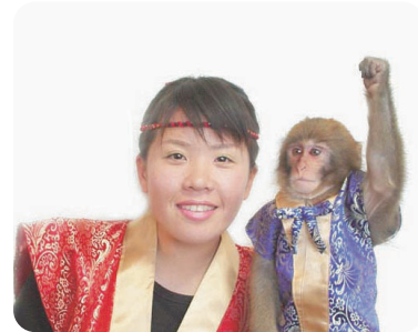
モンキーパフォーマンス 「びーなっつ」