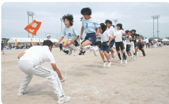
さあみんな心を一つにチャレンジだ！ 「チャレンジ・ザ・ギネス」