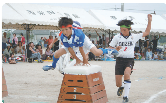
ジュニアスポーツの異種対決！ 「ちびっこ走れメロス」