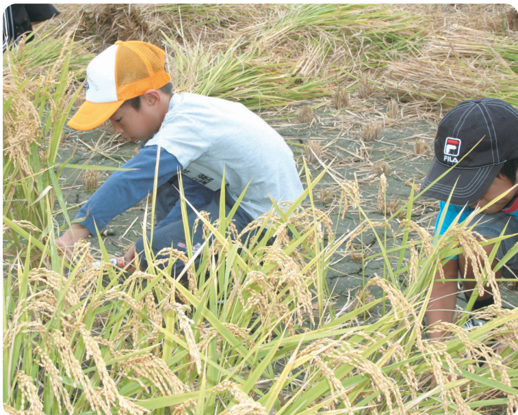
鎌を手に初めての稲刈り

9月29日(土)参加者16名により、筑後チルドレンズ・キャンパス「農といのちの物語」第2回稲刈り体験と料理作り体験が開催されました。今年の6月にみんなで田植えをした稲が収穫を向かえ、手作りした味噌が食べごろ、2つとも上手く出来上がっていて“ほっ”と一安心しました。