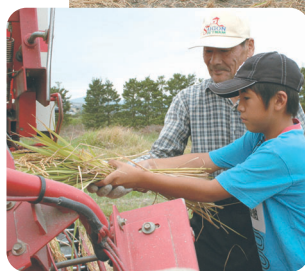
コンバインでの 脱穀に挑戦