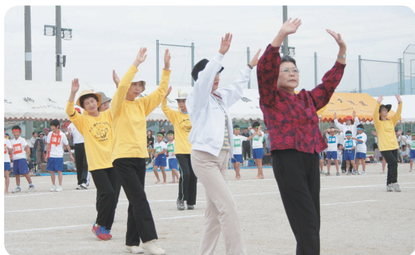
みんな輪になりほんによかこ大刀洗 「大刀洗音頭」