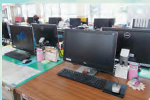
↑ 教育システム機器