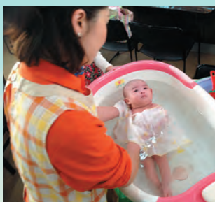
↑ 産後のケアの様子

子ども達が安心してのびのびと遊べるように遊具の取替えを行いました。また、大刀洗小学校の芝生化工事を実施します。そのほかにも、先生たちの事務負担軽減を目的に最新の教育システムの機器を購入するなど「チルドレンファースト」を合言葉に教育環境の充実を図ります。