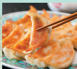
餃子彩館の手作り冷凍生餃子セット72個 宇都宮直伝の大人気一品。