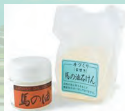
クリーンハートの「馬の油」 「馬油せっけん」 安心・安全無添加商品です。