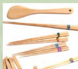
ひのき箸セット さくら市場の商品でもある心のこもった手作りの品です。