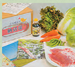
しゃぶしゃぶセット 町内の野菜と町内業者の豚肉、かばす醤油の組合せです。