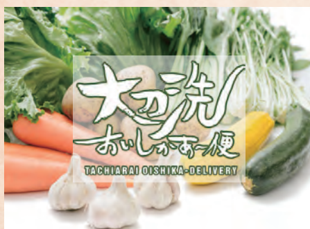
Sサイズ(7品目) Mサイズ(10品目)