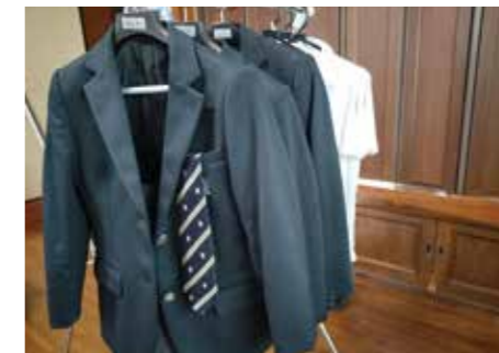
制服代や学用品代も大変

議員 医療費助成など、町独自の子育て支援は大いに評価したい。いっぽう、憲法では義務教育は無償としているのに、教材や学用品などで負担が大きい。実情や対策は。