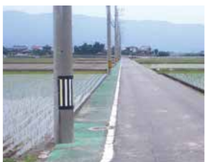
町道の電柱には占用料請求を

議員 道路占用許可の対象となる物件と許可基準、過去3年間の許可件数は。 課長 電柱、電線、上下水道などが対象物件で、道路の敷地外に余地がなく公益上やむを得ない場合に許可。過去3年間の許可件数は199件。