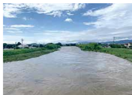
増水した小石原川

議員 ふるさと応援寄附金を財源に、小中学校の給食費を、国に先がけて無償化できないか。 町長 他自治体の動向と国の異次元の子育ての支援のあり方なども踏まえて、教育委員会とも十分相談したい。