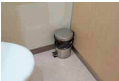
必要な人も少なくない

議員 膀胱がんや前立腺がんなどで、男性も尿取りパッドを使用している人がいて、外出先で捨てる場所がなく困っている。講演会などに参加したい場合や、災害時の避難にも二の足を踏むことにもつながりかねない。公共施設の男性用トイレにサニタリーボックスを設置する考えは。