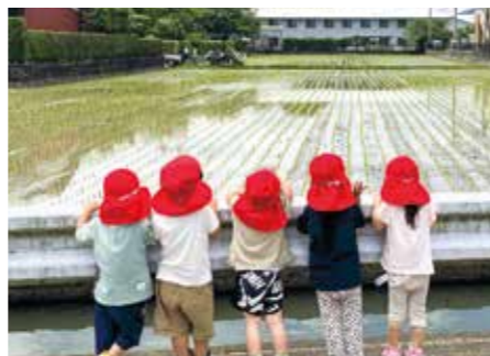
すくすくと育ってほしい(海の星保育園)

議員 乳幼児保育料を無 償化できないか。第 1子を半額補助、第2子以 降は無償とすることは。 町長 無償化は困難だが、 最高で5万1700 円という保育料は子育て世 帯にとって経済的負担が重 すぎるかと考えている。保 育料の減額ができないか、近