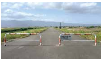
どうする？開かずの町道

議員 本郷の栄田橋から 目北橋区間の町道出 入口にバリカーが設置され、 車両が通行できない。道路 管理者である町長の見解は、 町長 冷蔵庫や洗濯機な どの不法投棄やごみ の焼却も多く、河川の環境 を考慮し、国交省と協議し