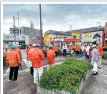
西鉄小郡駅前周辺清掃