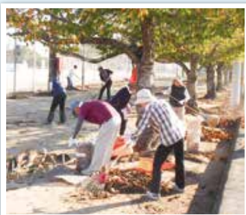
大刀洗町運動公園清掃