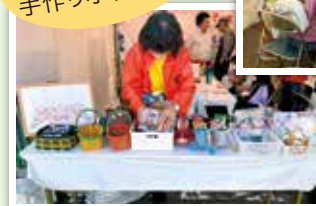
大刀洗町ドリーム祭りに参加