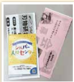
会員募集のチラシ