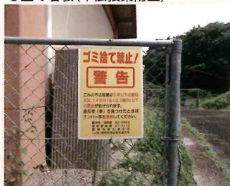
○立て看板(不法投棄防止)