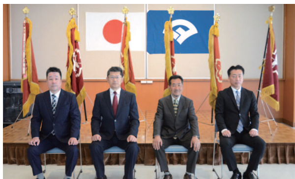
▲退任幹部（敬称略）〈左から〉

消防団員は、火災や災害から地域住民の生命・財産を守るため、平常時から訓練に励み、活動にあたっていますので、地域の皆さんのご理解、ご支援をよろしくお願いします。