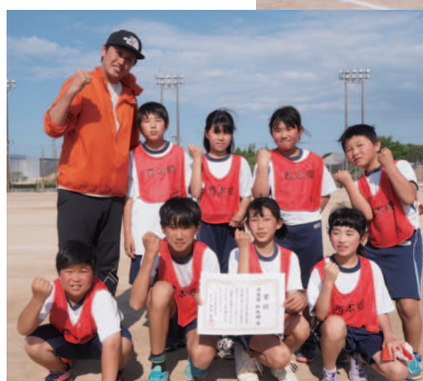
▲準優勝：西本郷分館B