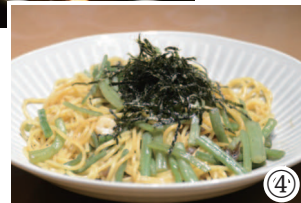
①店内の様子 ②調理している様子 ③特製デミカツ ④おっかさん直伝「山菜パスタ」

になってもらい、ファンになってももらえるよう、特に下処理や仕込みなどは手を抜かず、しっかりと時間と手間をかけることを大切にしています。寿司屋で修行した経験から、みそ汁や煮物などの和食料理は毎朝ダシを一から取り、醤油などの調味料は、それぞれの料理に合うよう独自にブレンド。また料理で使用している野菜の多くは、町の農家さんから採れたてで新鮮な野菜を直接仕入れています。