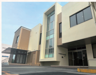
▲改修した中央公民館

鵜木川や防災重点ため池の浚渫、床島地区の内水排除に向けた排水ポンプの整備に着手しています。国・県事業では、筑後川の浚渫や有本橋、猪ノ本橋の架け替えのほか、流域治水の観点から大刀洗川、陣屋川で調節池の整備に取り組んでいます。また、消防団に内水排除用ポンプ等の資材を配備するとともに、機能別消防団員の制度創設や防災士の育成支援、避難所機能を強化した中央公民館の大規模改修や防災備蓄倉庫を整備しています。さらに、ハザードマップの改定や防災ラジオの貸出拡大、屋外防災行政無線の整備、テレビのdボタンやLINEを活用するなど情報発信を強化しています。