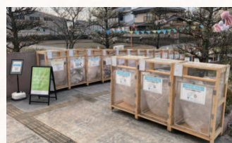
▲資源回収ステーション

町内外の人が交流・対話を深める「つながりの学校PLAT」を開講するとともに、各校区に資源の3Rとコミュニティの活性化を目指した資源回収ステーションを設置しました。