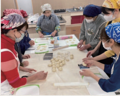
▲SAOTOME女性学級 パンづくり教室