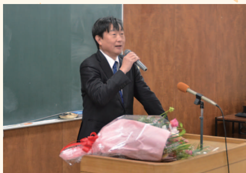
▲就任式で職員に訓示している様子

1月30日(火)に初登庁した中山町長は、就任式で「役場職員だけでは一定の限界があり、町民の皆様との対話を大切にし、地域や町民の皆様を応援するような町政を目指していきたい」と職員に話しました。