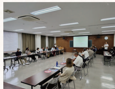
▲防災士の集いの様子