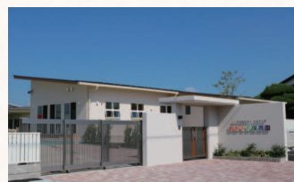
▲開園したおおぞら保育園

また、小中学校では、1人1台のタブレットや電子黒板を活用したICT教育、各種学校支援員の増員や特別支援教育の充実、コミュニティスクールの推進などに取り組み、小中学生の学力も向上しています。