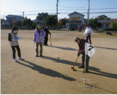
▲菊池女性学級 グラウンドゴルフ大会