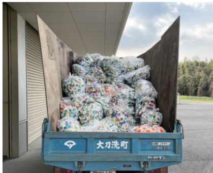
▲キャップの回収・搬出の様子