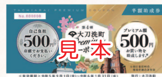
▲配布したプレミアムクーポン券

コロナ禍を踏まえ、町民の皆さんの暮らしと町内の事業者を応援するためプレミアムクーポン券を配布するとともに、商工会のプレミアム付商品券のプレミアム率および発行額を拡大しました。また、「大刀洗マルシェかてて」を通じて、地産地消を推進しています。