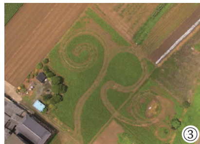
①店内の様子 ②商品と向き合う姿 ③店舗裏の「三川藍」畑（自身でロゴマークのRを表現）