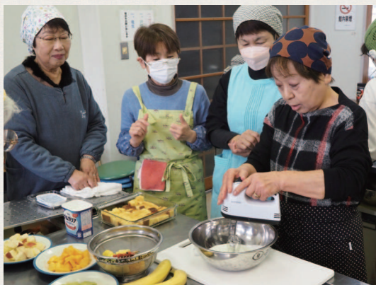
▲本郷女性学級 ケーキづくり教室