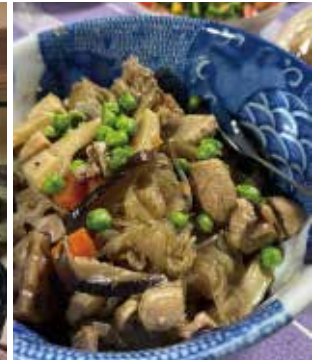
1日目/懇親会（がめ煮など郷土料理や地酒でおもてなし）