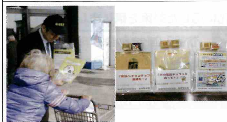
【飯塚】大型商業施設にて、バレンタインデーにちなみ、二セ電話詐欺キャンペーンを実施。「その電話チョコっと待って!」など掲載のチョコの袋とチラシを配布して注意を呼びかけ