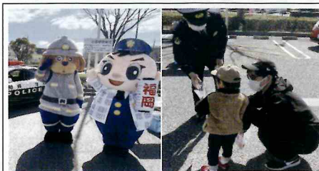
【東福岡】防火・防災のための「来て！見て！消防たい(隊)」のイベントにて、防犯アプリ「みまもっち」や自転車防犯登録に関するチラシや啓発品を配布し、犯罪被害防止を呼びかけ