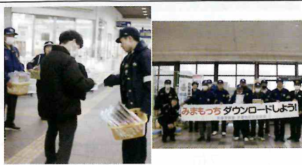
【宗像】福津市で二セ電話詐欺、SNS型投資・ロマンス詐欺被害防止の呼びかけを、福岡駅では防犯アプリ「みまもっち」のリニューアルに伴うキャンペーンをそれぞれ実施