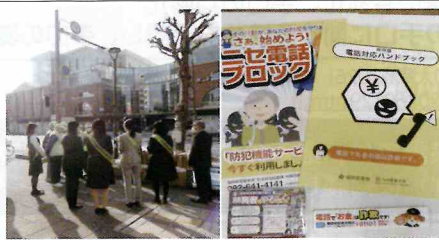
【久留米】金融機関前にて、警友会や金融機関防犯連絡協議会の協力を得て、二セ電話詐欺抑止キャンペーンを実施。「二セ電話対応ハンドブック」や啓発物等を配布し注意を呼びかけ