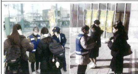
【城南】受験期における痴漢等防止のため、「盗撮・痴漢防止キャンペーン」を実施。城南高校、中村学園女子高校3年生に対し、啓発物を配布し注意をよびかけ