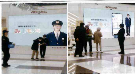
【粕屋】大型商業施設にて、リニューアルされた防犯アプリ「みまもっち」について、広報動画を流したほかチラシ等を配布するなどしてインストールを呼びかけ