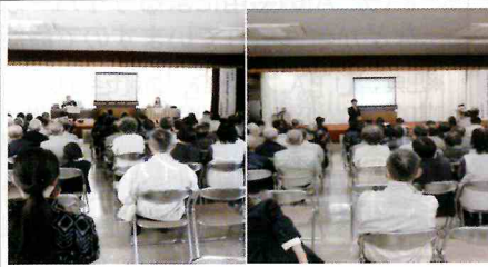
【八女】上陽町公民館にて二セ電話詐欺被害防止キャンペーンを実施。警察官を騙った二セ電話詐欺の寸劇のほか、国際電話利用休止サービスの活用などを呼びかけ