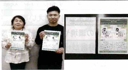
【小倉北】管内の中学・高校生を対象に、「SNSを正しく使い安全・安心な社会を作るにはどうすればよいか」のテーマで標語募集。受賞作品掲載のファイルを作成し管内の中学・高校に配付