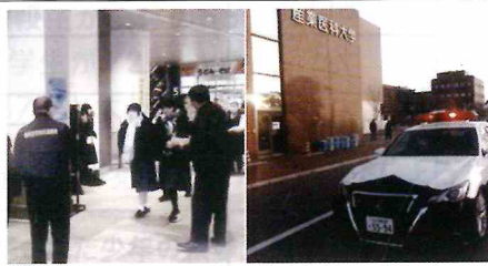
【折尾】受験期における痴漢対策のため、JR折尾駅をはじめとする駅9か所及び受験会場にて、警戒を実施するとともにチラシ等を配布し被害防止を呼びかけ