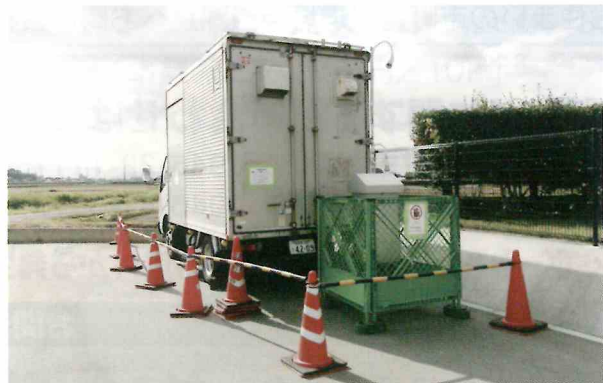
大気質調査の観測車