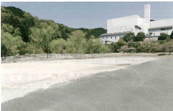
リサイクル工房棟跡地

また、次期ごみ処理施設の建設計画に伴って、令和7年10月から実施中の生活環境影響調査は、今年9月末までの予定となっています。周辺地域住民の皆様におかれましては、引き続き、調査へのご理解とご協力をよろしくお願いいたします。